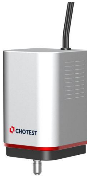
图 1.WX-100 白光干涉测头

SuperView WX 100 白光干涉测头是一款非接触式精密光学测头，其基于白光干涉和精密扫描研制而成，主要由光学干涉系统和 Z 向扫描系统组成，具有体积小、重量轻、便携的特点，能够方便地搭载在各种具备 XY 水平位移架构的平台上，在产线上对器件表面进行自动化形式的测量，直接获取与表面质量相关的粗糙度、轮廓尺寸等 2D/3D 参数。